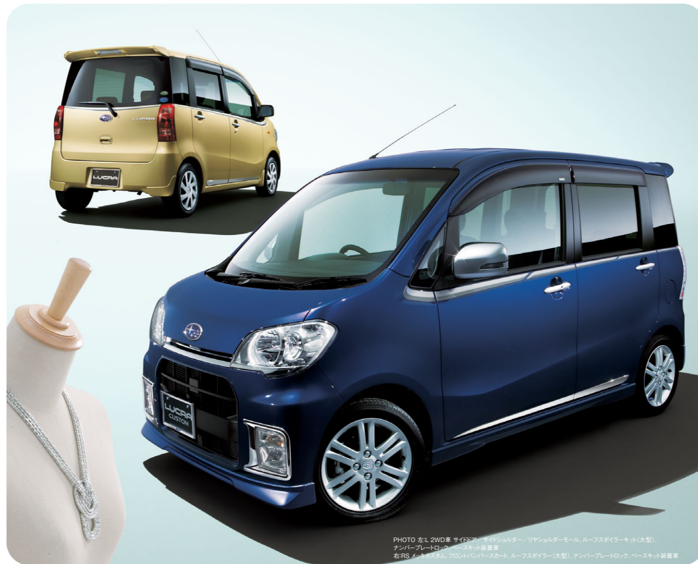
PHOTO 左:L2WD車 サイドドア サイドショルダー、リヤショルダーモール、ルーフスポイラーキット(大型)、 ナンバープレートロック、ベースキット装着車 右:RS メッキカスタム、フロントバンパースカート、ルーフスポイラー(大型)、ナンバープレートロック、ベースキット装着車