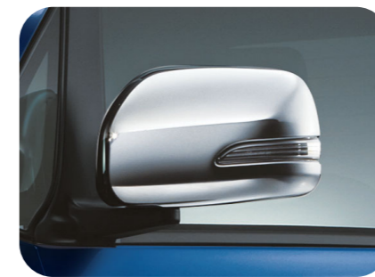
メッキドアミラーカバー ¥15,750

〈カスタム〉J1047K1070 ¥16,000+税¥3,000 *樹脂製 お得なメッキカスタム [p5] でも購入できます。