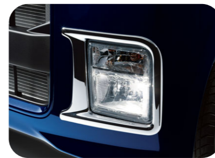
フォグランプエスクッション ¥19,950

〈全車〉J1047K1020 ¥34,000+税¥3,000 *樹脂製 お得なメッキカスタム [p5] でも購入できます。