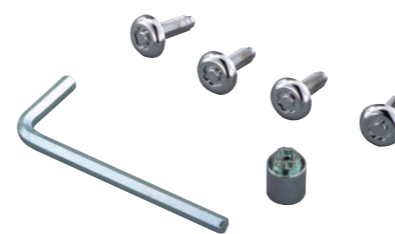
ナンバープレートロック ¥3,675

〈全車〉 お得なベースキットでも購入できます。詳しくは [p4] をご覧ください。