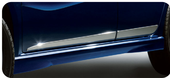
サイドドアモール ¥38,850

〈全車〉J1047K1000 ¥20,000+税¥4,000 *PVC製 お得なメッキカスタム [p5] でも購入できます。