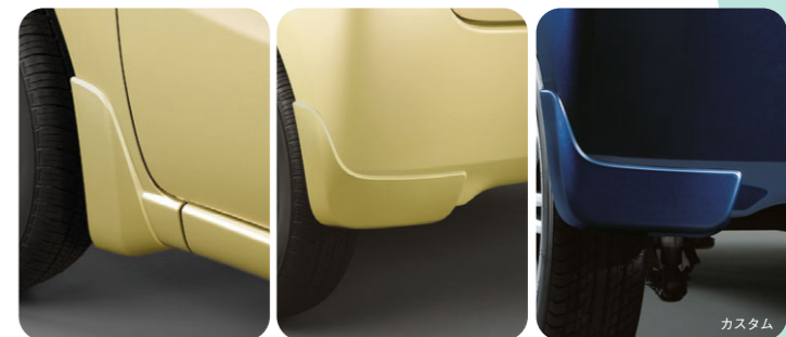
スブラッシュボードセット/スブラッシュボードリヤセット 〈全車〉 お得なベースキットでも購入できます。詳しくは [p4] をご覧ください。

〈全車〉E7248K1500# ¥36,000+税¥6,000 [ルーフスポイラー標準装備車は E7247K1200# ¥32,000+税¥6,000] *ルーフスポイラー標準装備車は標準装備のハイマウントストップランプを流用します。 *品番末尾の##にはカラーコードが入ります [p4参照]。 *標準装備のルーフスポイラーとは形状が異なります。