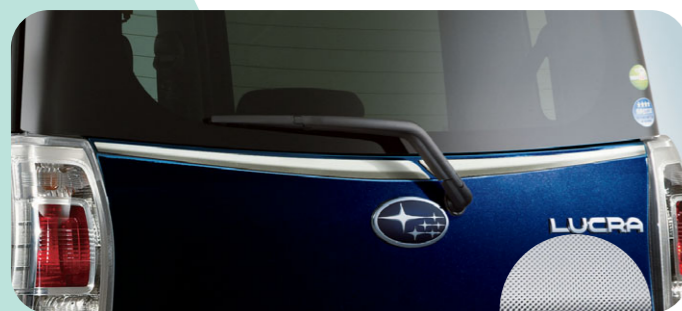
リヤショルダーモール ¥8,925

〈カスタム〉J1047K1050 ¥14,000+税¥1,000 *樹脂製 お得なメッキカスタム [p5] でも購入できます。