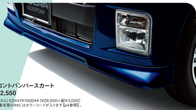
フロントバンパースカート ¥32,550

定番のエアロから、人気のメッキアクセントまで、 確実なフィッティングと違和感のない個性が、純正ドレスアップの魅力。 お得なベースキットやメッキカスタム [p4-5] でのコーディネートもおすすです。