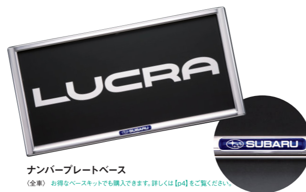
ナンバープレートベース

〈全車〉J1047K1015 ¥7,000+税¥1,500 *PVC製 お得なメッキカスタム [p5] でも購入できます。