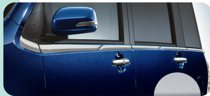
サイドショルダーモール ¥25,200

〈全車〉J1047K1000 ¥20,000+税¥4,000 *PVC製 お得なメッキカスタム [p5] でも購入できます。