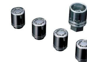
ホイールロックセット ¥7,350

〈全車〉J1077YA001 ¥3,500 詳しくは [p15] をご覧ください。