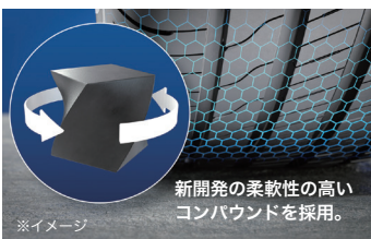
※イメージ 新開発の柔軟性の高いコンパウンドを採用。

トレッド部に弾力性と柔軟性が高いコンパウンドを使用。様々な温度域でコンパウンドの破損を防止することで、さらなるロングライフを実現します。