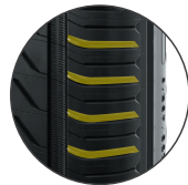
ロングラスティング スカルプチャー