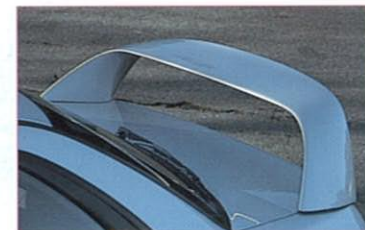
大型リヤスポイラー(ハードトップセダン)