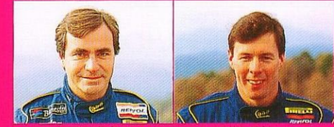
カルロス・サインツ