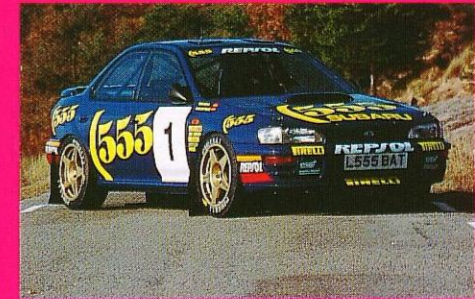
インブレッサWRX、BMWRC仕様車